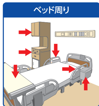
ベッド柵・テーブル・床頭台など

*4 大理石や銅、亜鉛および軟鋼などは酸化作用により劣化する恐れがありますので使用しないでください