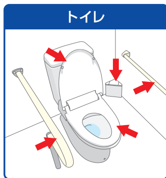
便座・フタ・手すり・汚物入れ